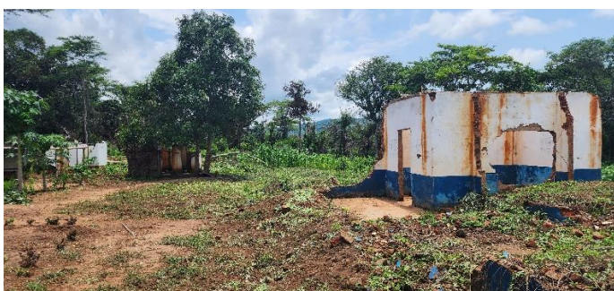
Figure 2: le centre de santé de Kabeya Mukena complètement détruit