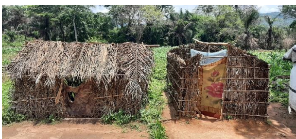
Figure 1: type d'un abri de fortune que se construisent les retournés