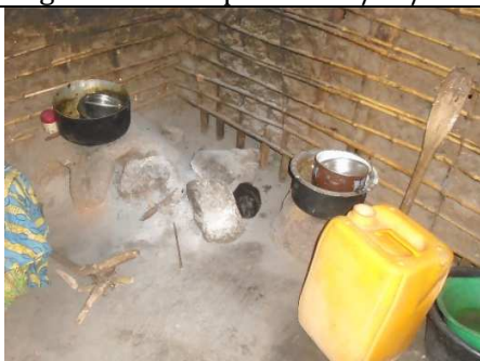
Intérieur d'une habitation - articles ménagers appartenant à une famille d'accueil