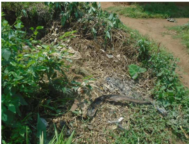
Habitation détruite - Kagando -Photo prise le 25/01/2020