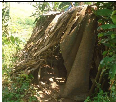
Kagando -Photo prise le 25/01/2020