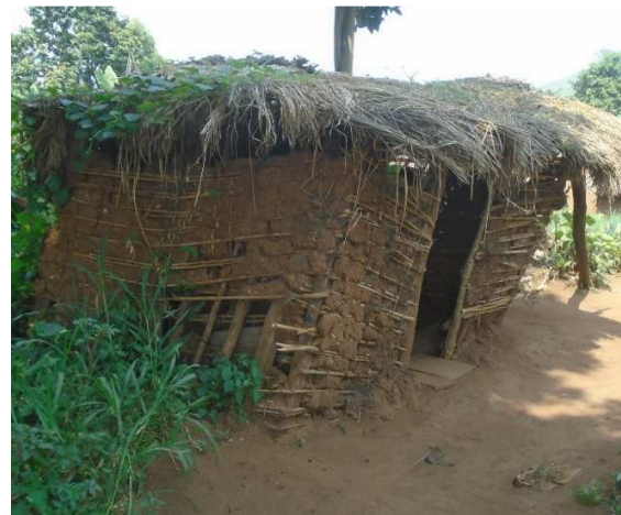
Habitation endommagée - Kagando -Photo prise le 25/01/2020