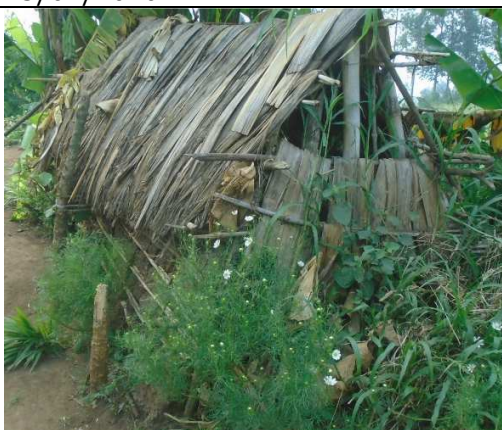
Abris de fortune pour les familles déplacées ou familles retournées dont leur habitation a été détruite - Kagando -Photo prise le 25/01/2020