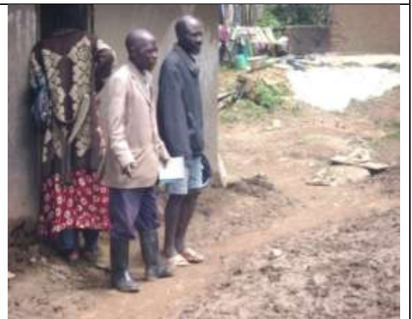
L'équipe de PAP-RDC orientée par le chef à KASIMA