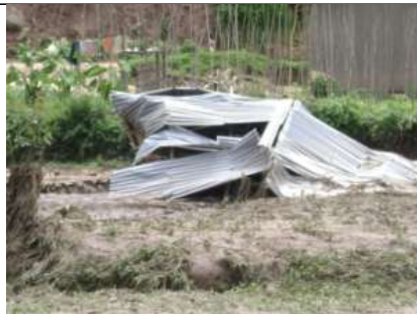
Le décombre d'une maison à KASIMA