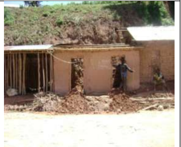
Une maison détruite par un éboulement de terre à KATONDI