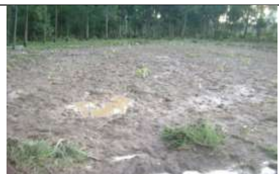
Un champ ensemencé raclé par les eaux à KITSOMBIRO