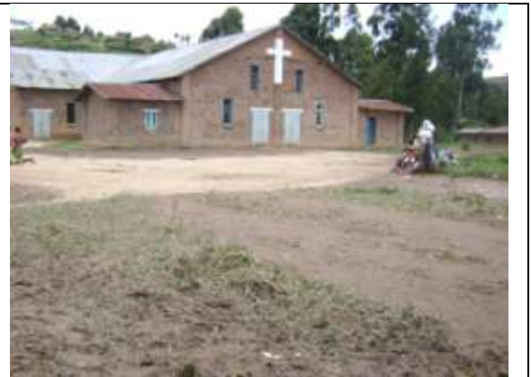
L'Eglise catholique de KASIMA a été aussi dévastée par les eaux à une hauteur de 1m