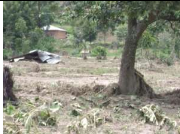
Une maison en semi durable détruite à KASIMA