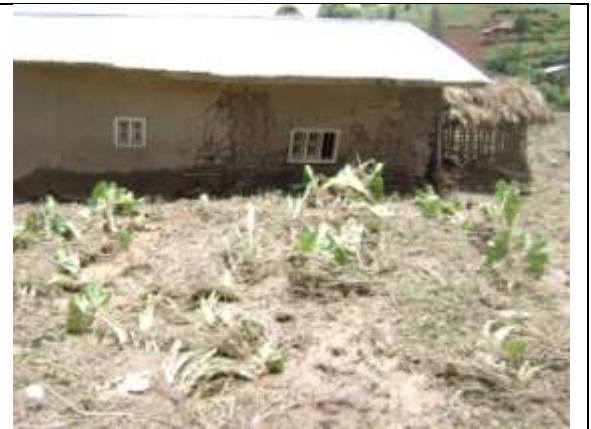
La maison à moitié détruite à sa face arrière