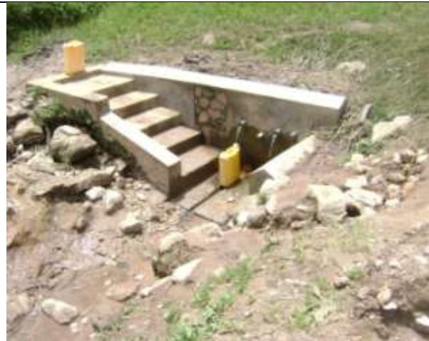
La source KIGHENDE aménagée par CEPROSSAN à KASIMA a échappé de justesse ; mais est menacée par l'érosion