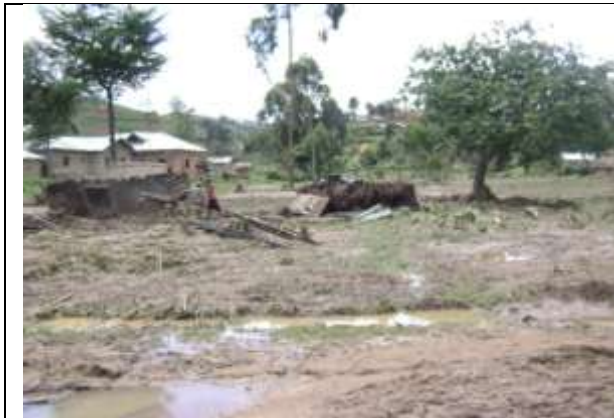
Une case détruite à côté de la rivière KAVIGHUVO