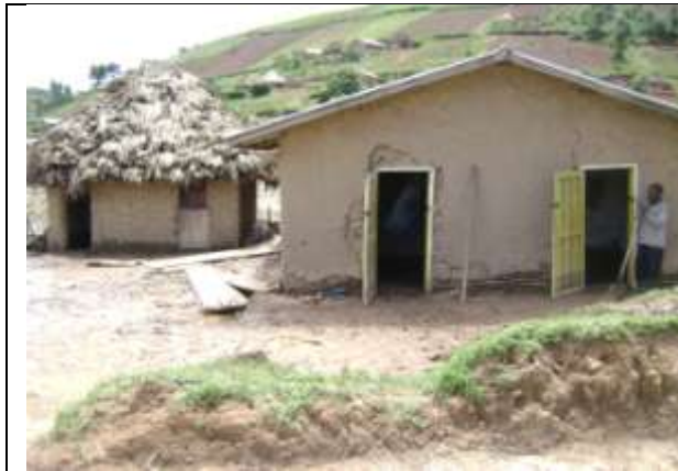
Un homme désespéré qui essaie de vider la boue dans sa maison à moitié détruite