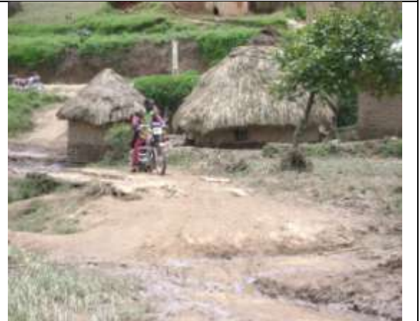
Les cases qui s'enfoncent à côté d'un pont déstabilisé par les eaux de la rivière KAVIGHUVO