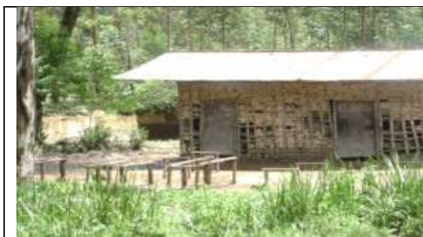
L'atelier d'apprentissage de la menuiserie d'ACPMI KITSOMBIRO

Quelques photos illustratives de la situation :