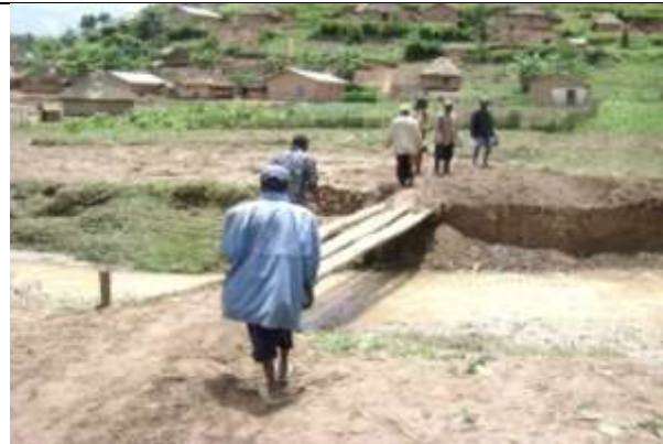
Un pont jeté d'urgence sur la rivière KAVIGHUVO dans l'entretemps.