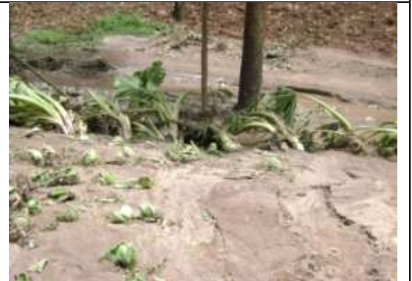
Choux et taros emportés dans la vallée