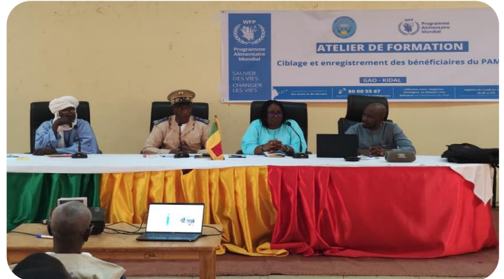
Photo 1 : Lancement de l'atelier de ciblage des bénéficiaires en préparation de la réponse à la soudure à Gao. Avril 2026