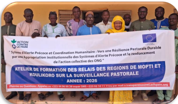
Photo 3 : Photo de famille de la formation des relais des régions de Mopti et Koulikoro sur la surveillance pastorale. Avril 2026

Participation de la coordination du Cluster aux échanges avec les partenaires sur la relocalisation et l'assistance des personnes déplacées internes des sites urbains de Bamako (Niamana, Faladié, Senou etc.) sur le site de Baguineda