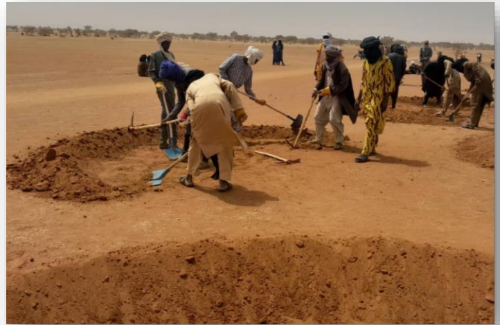
Photo 2 : Séance pratique de la formation des bénéficiaires sur des techniques de conservations des eaux et des sols à Gao. Avril 2026