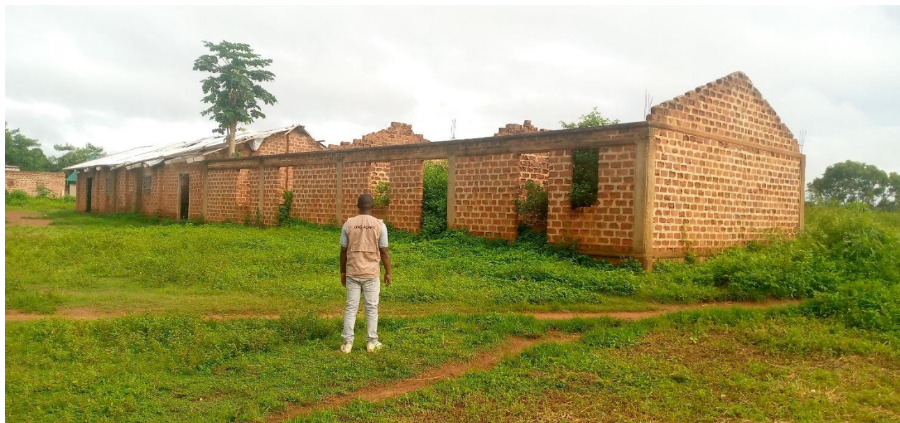
Ecole sous préfectorale de ABBA

Aucune école visite n'a ni installation sanitaire moins encore de l'eau, les enfants font la défécation à l'air libre qui est une pratique dans le milieu scolaire avec les conséquences désastreuses