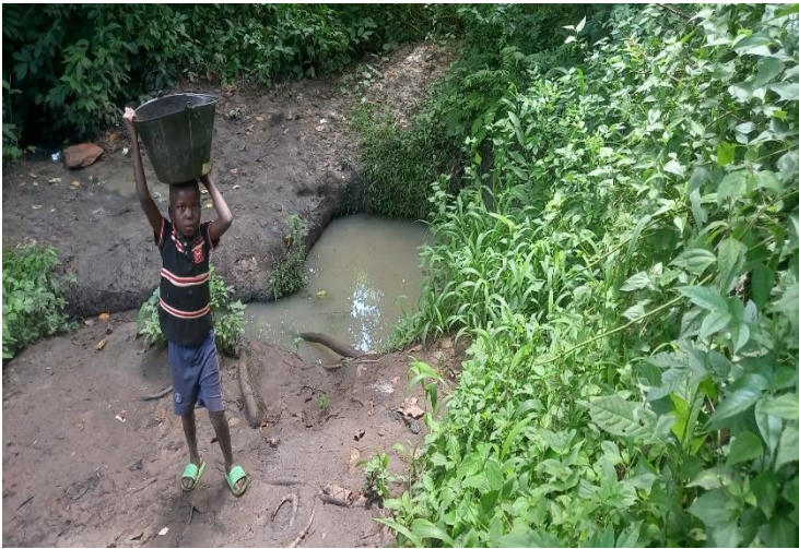
Source d'eau Non aménagé au quartier Bopkane 1