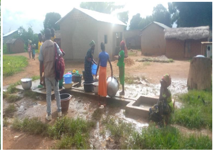
Point Non aménagé au quartier Haoussa