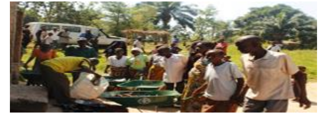
Distribution de kits agricoles à la rivière Muya Bena Ditutu, Mbuji Mayi

*TANGANYIKA : FAO: Assistance en kits maraichers (arrosoirs, rateaux, houe, semences) à 100 ménages suivis par UNFPA sur le site de Katanika à Kalemie. FAO/BDC: formation en maraichage des déplacés et familles d'accueil dans le même site.