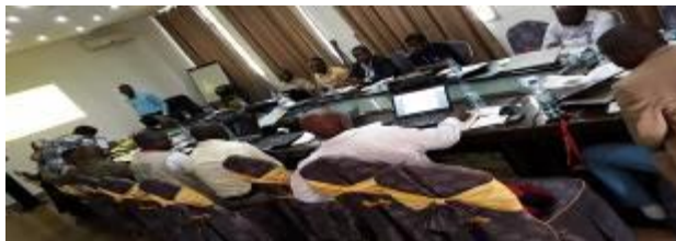
Plénière IPC aigue 16 ème cycle. Cap Kivu Hôtel, Goma.

*NORD KIVU & MANIEMA : Démarrage des analyses IPC aigue 16 ème cycle.