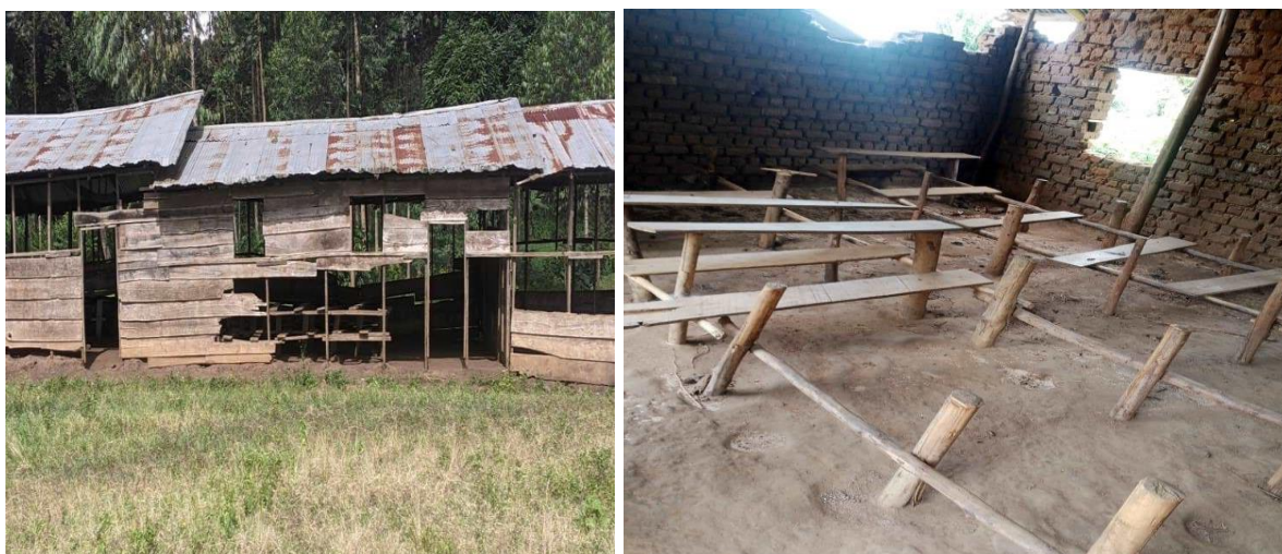
Photos : Situation des salles de classes dans le Territoire de Rutshuru, Mai 2023