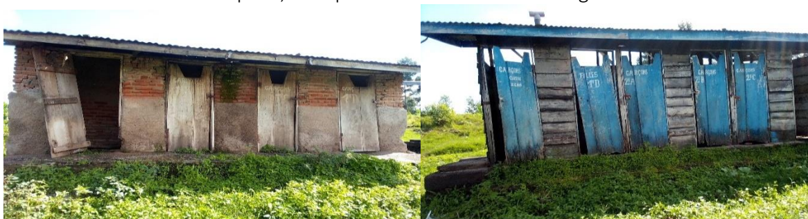
Photos comment : Situation des latrines dans les écoles de Rutshuru, Mai 2023

Dans toutes les écoles évaluées au niveau des Sous-Divisions de Rutshuru 1, 3, 4 la plupart des latrines sont détruites et d'autres remplies surtout pour les écoles qui avaient été occupées par les déplacés ou les groupes armés et d'autres furent détruites ou incendiées. Plusieurs écoles n'ont pas de point d'eau dans la cour scolaire et celles qui en ont sont déjà détruits pendant les conflits. Nous avons trouvé seulement dans 72 écoles évaluées, 13 écoles soit 18% possèdent des douces d'eau opérationnelles. Les écoles qui avaient de kit de lavage des mains, des tanks collecteurs des eaux de la pluie, sont pillés et d'autres endommagés.